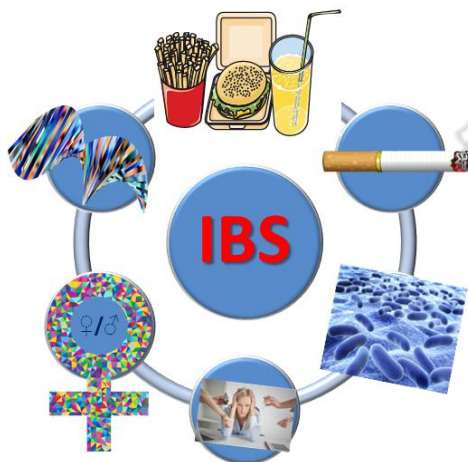
Figuur 2: Samenvatting van factoren die van invloed kunnen zijn op het voorkomen van PDS: lifestyle (zoals voeding en roken), darminfecties, stress/trauma, vrouwelijke geslacht, genen